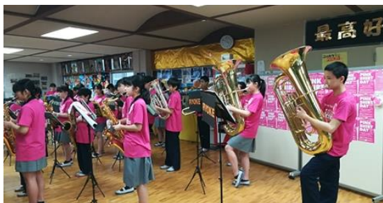
(横浜市立領家中学校の様子)

ファイナルイベントに出演予定だった領家中学校吹奏楽部と東高校サスティナブル研究部はそれぞれ、校内でピンクシャツデーアクションを起こしたとのことです・確実に輪は広がっています。