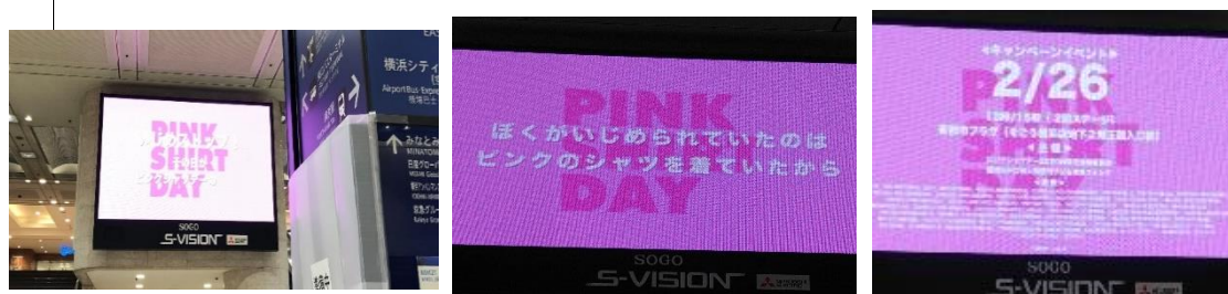
(そごう前・サイネージ大型モニター)