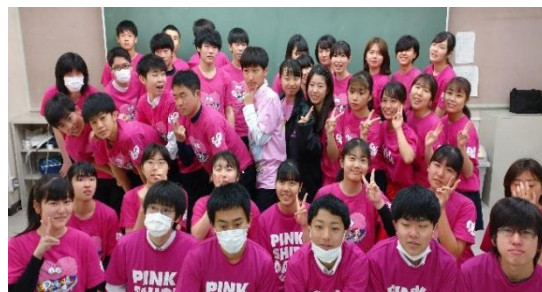
(横浜市立東高校の様子)