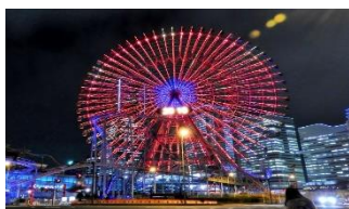
よこはまコスモワールド

そごう前広場でキャンペーンソングのお披露目 N.U. 声優陣/企業・団体・商業施設での取り組み（横浜高島屋）