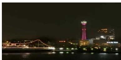
横浜マリントワー

・2019 in 神奈川/2018年9月に推進委員会発足。2019年2月27日（水）横浜駅東口そごう前でメインイベントを開催。また2月をキャンペーン月間とし、告知イベントを開催しました。