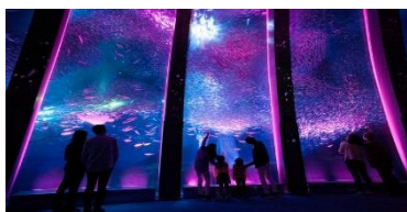
金沢八景島シーパラダイス